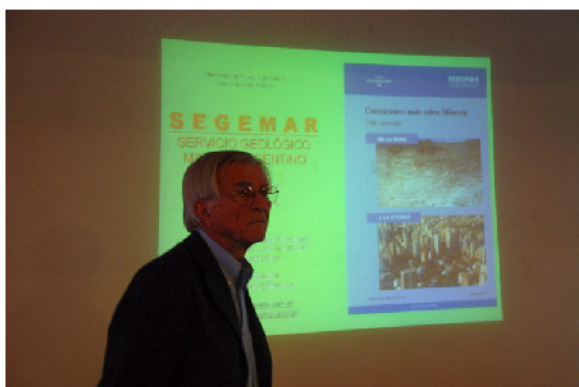
Eddy Lavandaio Reflexiones sobre Minería - SEGEMAR