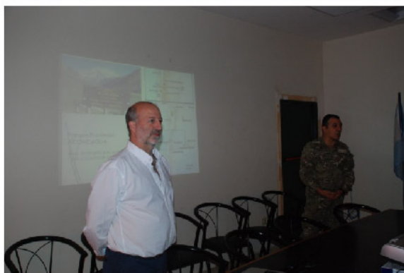
Proyecto Aconcagua - Ejército Argentino